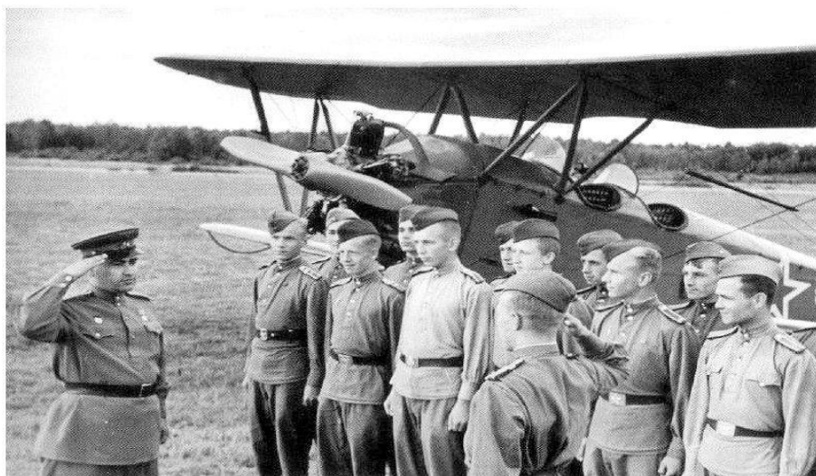
Алексей Маресьев в авиационном училище, 1945 г.

В июне 1944 года майор Маресьев становится инспектором-лётчиком Управления ВВС.