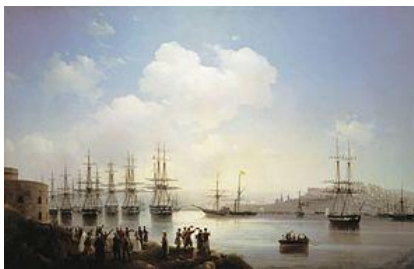
Русская эскадра на севастопольском рейде