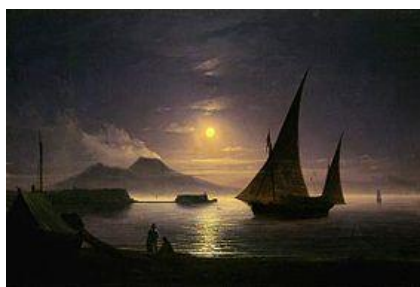
Неаполитанский залив. 1842

Автопортрет художника хранится в галерее Уффици (Италия).