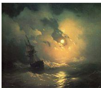
Буря на море ночью. 1849