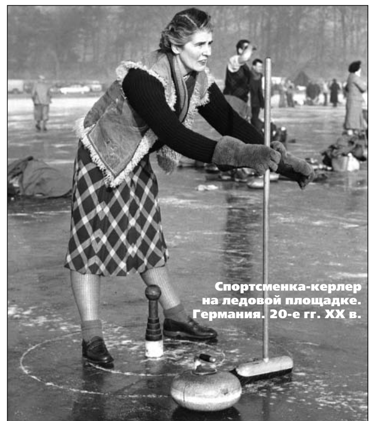
Спортсменка-керлер на ледовой площадке. Германия. 20-е гг. XX в.