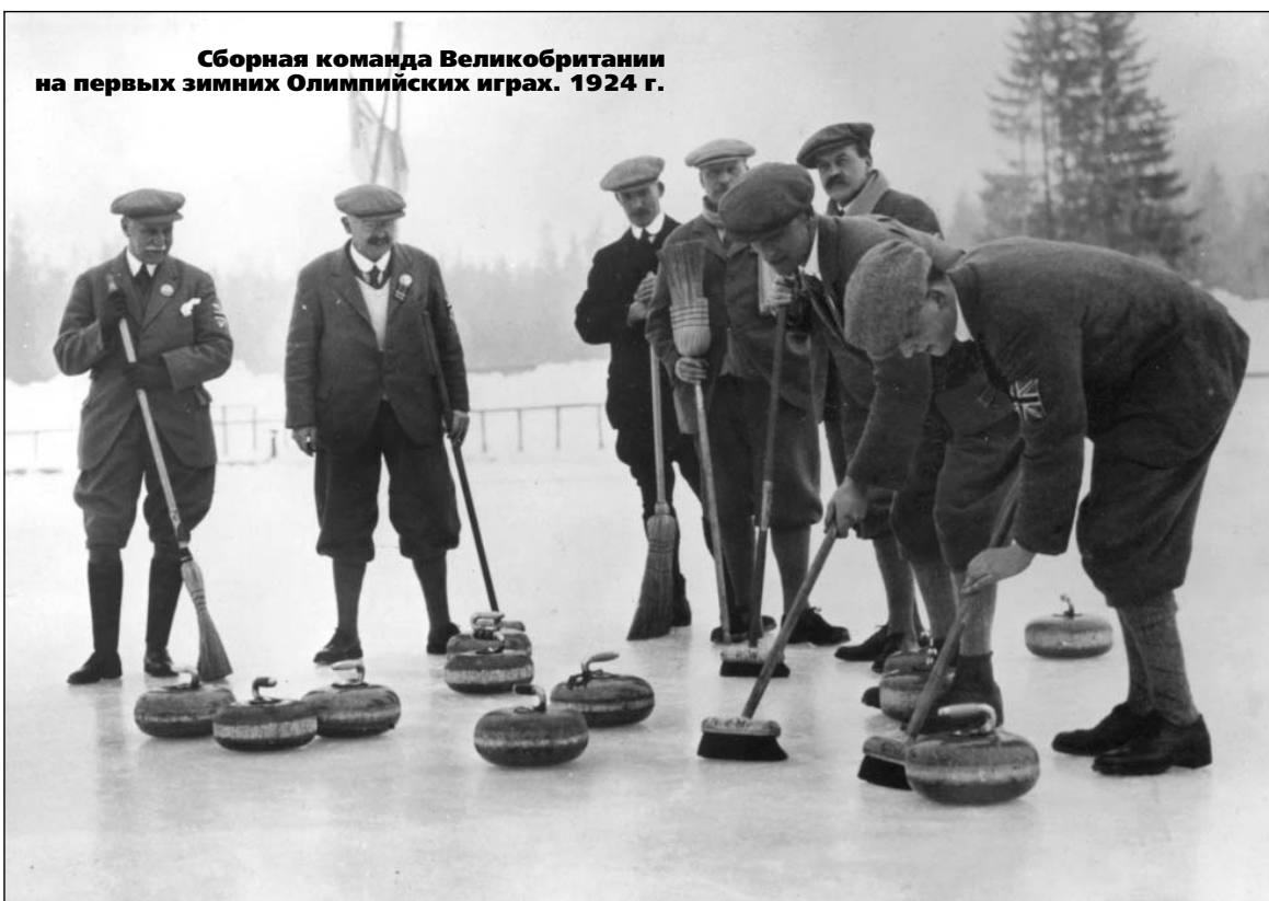
Сборная команда Великобритании на первых зимних Олимпийских играх. 1924 г.