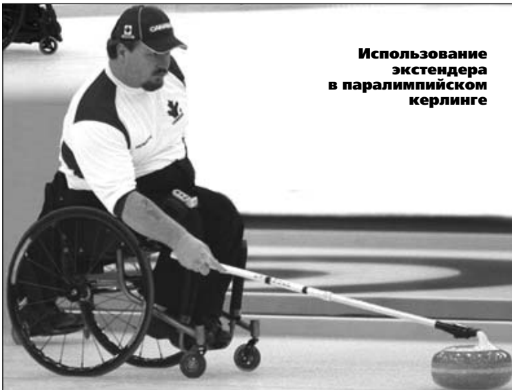
Использование экстендера в паралимпийском керлинге