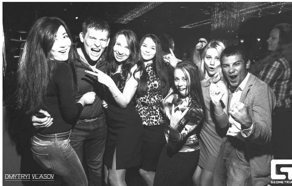
Посвящение в студенты (2013 год)