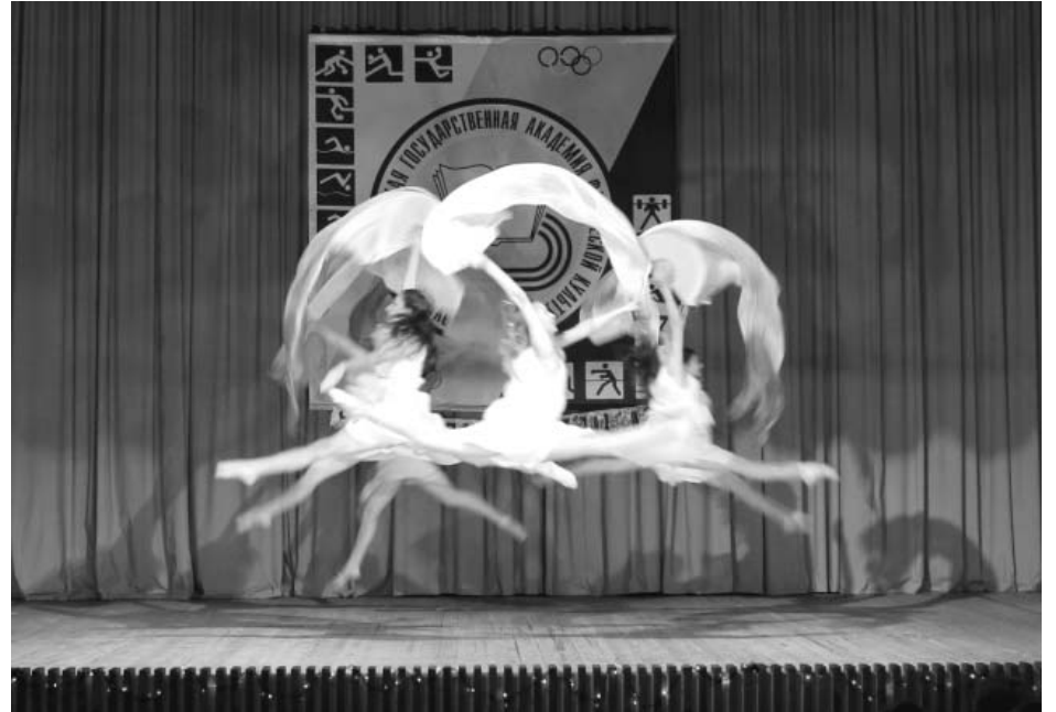
Концерт к Новому году — 2014 был подготовлен силами студентов

Комбинированная легкоатлетическая эстафета, пулевая стрельба, женский стритбол, мужской пляжный волейбол, перетягивание каната, гиревой