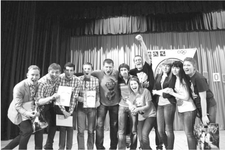
КВН — это море положительных эмоций и драйва (команды, занявшие первое и второе места в 2013 году)