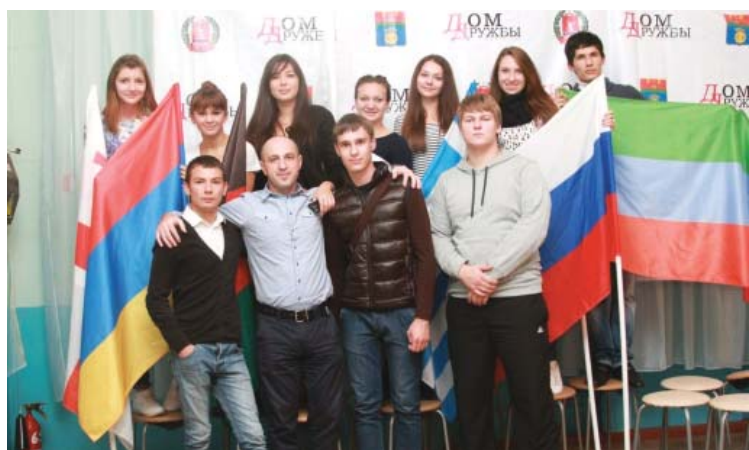
Студенты ВГАФК — участники городского форума по межнациональным отношениям