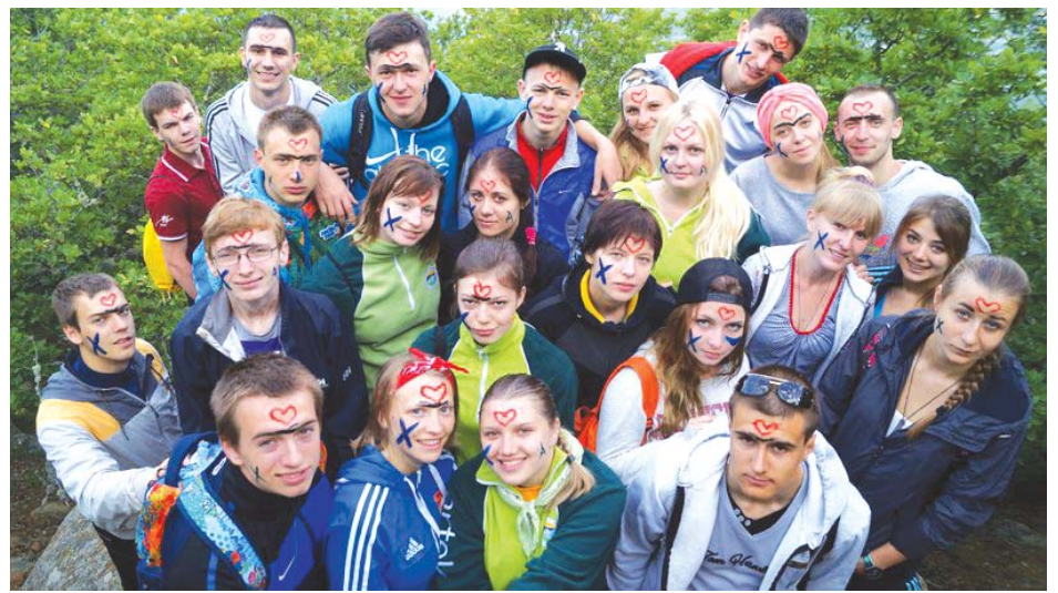
Посвящение в артековцы (в «Хрустальном»)