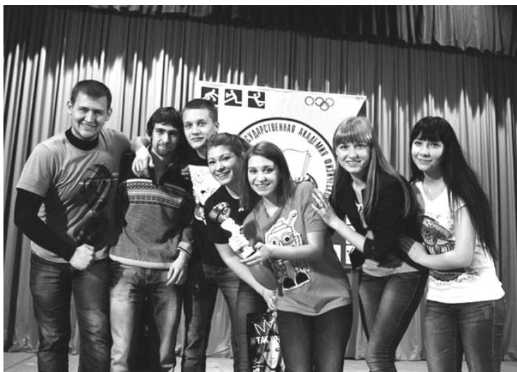
Победители — команда «Бен Чепяк»