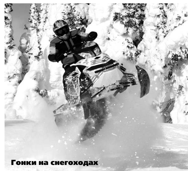
Гонки на снегоходах

О востребованности сноубординга свидетельствует тот факт, что некоторые его виды официально признаны международным спортивным сообществом и включены в программу олимпийских