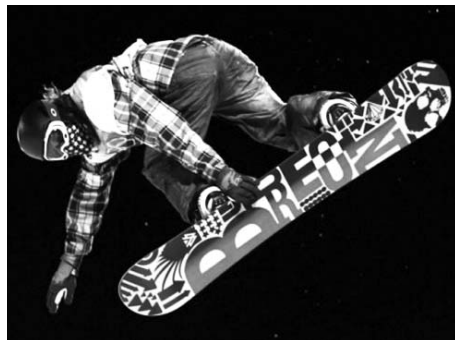
Двукратный олимпийский чемпион по хэмпайпу Шон Уайт на трассе. Ванкувер, 2010 год

Ежегодным знаменательным событием в мире экстремального спорта становятся Всемирные экстремальные игры, получившие в