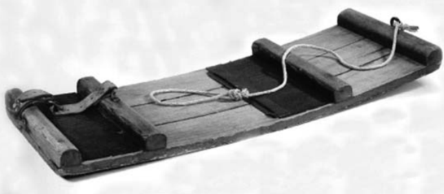
Прообраз современного борда

ния. Во время катания основная нагрузка приходится на четырехглавые, ягодично-седалищные мышцы, мышцы бедер и икр, подколенные сухожилия. Именно эти группы мышц укрепляются благодаря движениям, выполняемым при спуске с горы, в частности при поворотах на носках и пятках. Во время райдинга укрепляются также мышцы брюшного пресса, косые мышцы и поясница и, конечно же, развивается общая гибкость.