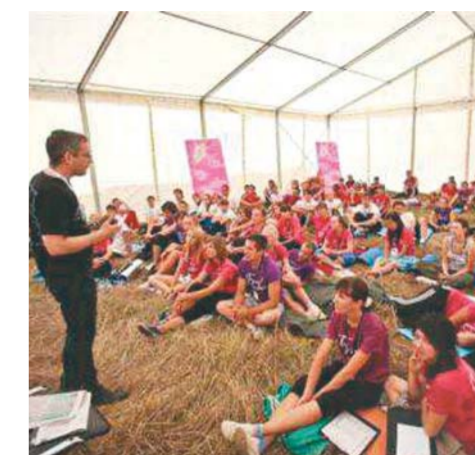
Лекция в шатре «Беги за мной!»

Образовательный форум «Волга» уже несколько лет подряд проводится летом на крупнейшем речном острове Европы — Сарпинском, который представляет собой уникальный природный парк. Площадка, на которой проходят мероприятия форума, с одной стороны прилегает к Волге, а с другой омывается озером.