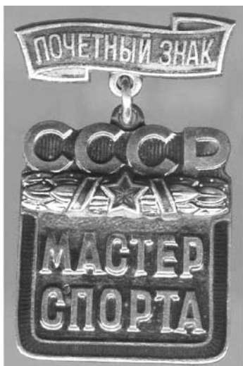
Знак «Почетный мастер спорта»

Одним из наиболее почитаемых человеческих качеств во все времена и у разных народов считалось обладание солидным багажом профессиональных навыков, умело применяемых на практике. Латинское «магистр», итальянское «маэстро», немецкое «мастер» — так издавна с уважением обращались к людям, достигшим совершенства в своем деле. Это было символом общественного признания. Неслучайно в одном из научных трудов по психологии слово «мастерство» трактуется как высший уровень профессионального развития личности в определенной деятельности, признанный обществом, имеющий ярко выраженные индивидуальные признаки и определяемый по конечному продукту труда. Звание «Мастер спорта», как известно, — один из современных вариантов признания заслуг наиболее целеустремленных и талантливых российских атлетов. Но сегодня уже мало кто из молодого поколения знает, что в перечне советских спортивных регалий на протяжении почти 30 лет существовала особая награда — Почетный знак «Мастер спорта». Он вручался спортсменам высокого класса, которые на протяжении 5 лет в соревновательном процессе стабильно демонстрировали мастерский результат. Среди наших коллег этим знаком отмечены бывшие преподаватели кафедры гимнастики Юрий Васильевич ЯЗОВСКИХ и Наталия Александровна ТЕПЛОВА.