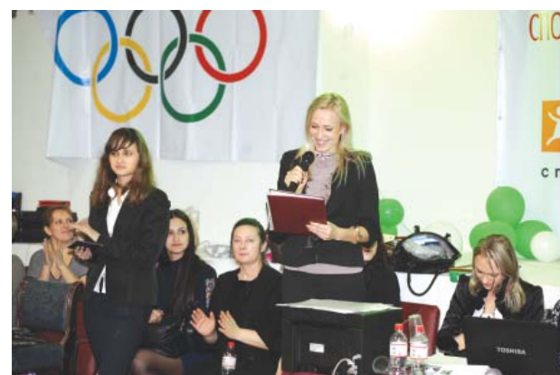
Главный судья соревнований подводит итоги турнира