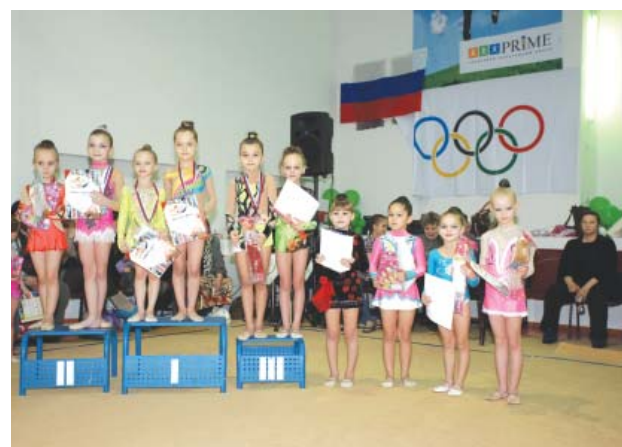
Победители и призеры