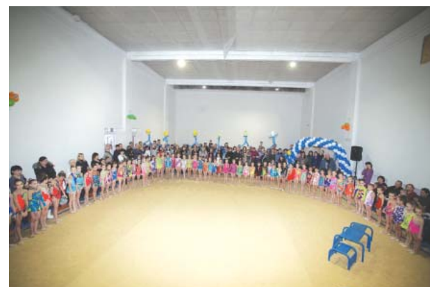
В турнире приняли участие 70 юных дарований