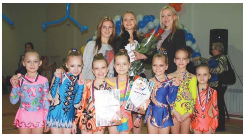
Юные чемпионки и их наставницы