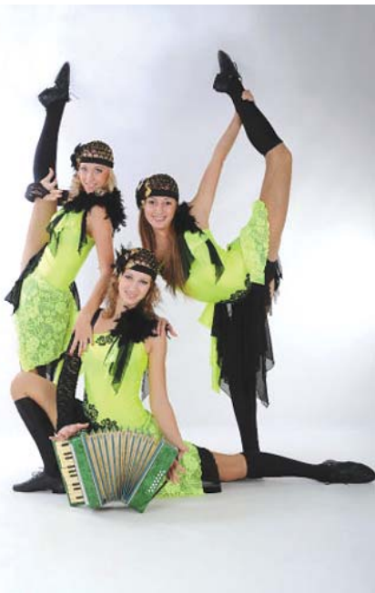
Как всегда, одним из самых ярких выступлений был номер «Арабесок»