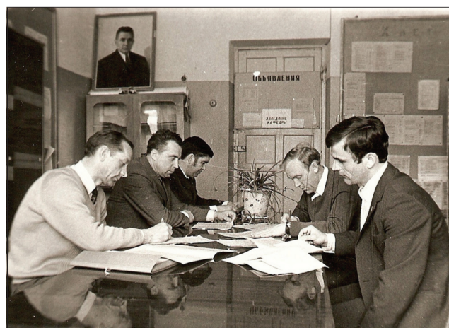
Кафедра за работой. 60-е гг.