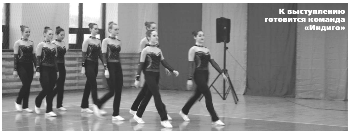
К выступлению готовится команда «Индиго»