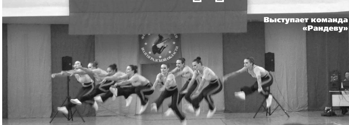
Выступает команда «Рандеву»