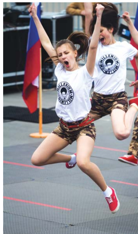
Это фото А. Бровкина заняло четвертое место в конкурсе «О спорт, ты мир!»