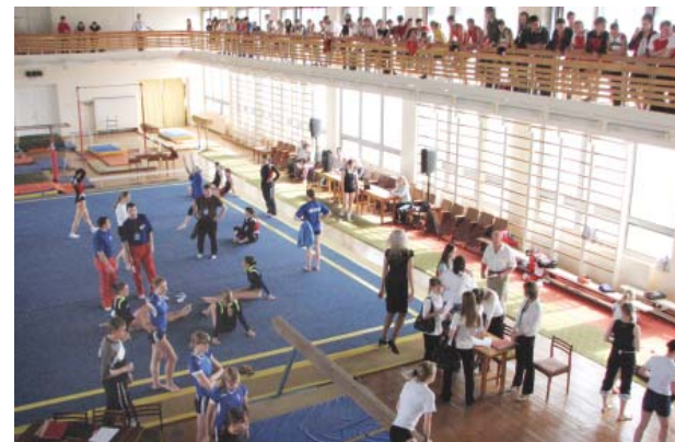
На соревнованиях по спортивной гимнастике