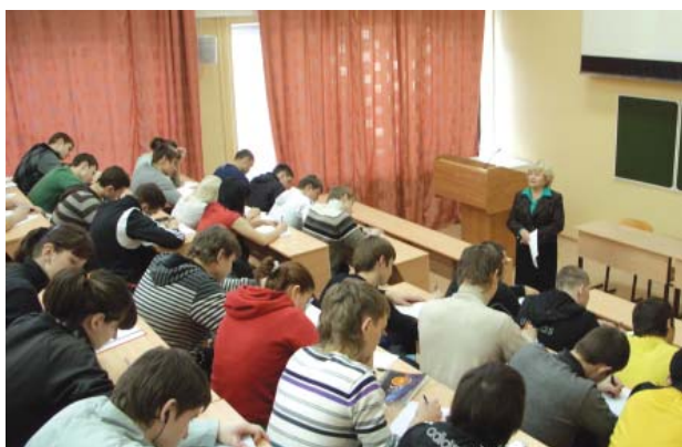
Занятия в поточной аудитории № 114

■ 49.03.02 «Физическая культура для лиц с отклонениями в состоянии здоровья (адаптивная физическая культура)» , дневная (бакалавр — 4 года) и заочная (бакалавр — 5 лет) формы обучения по