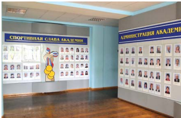
Холл с портретным рядом

МИНИСТЕРСТВО СПОРТА РОССИЙСКОЙ ФЕДЕРАЦИИ Федеральное государственное бюджетное образовательное учреждение высшего профессионального образования «ВОЛГОГРАДСКАЯ ГОСУДАРСТВЕННАЯ АКАДЕМИЯ ФИЗИЧЕСКОЙ КУЛЬТУРЫ» Приемная комиссия