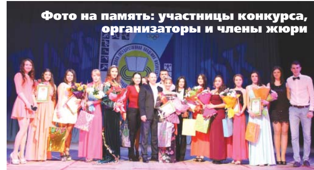
Фото на память: участницы конкурса, организаторы и члены жюри