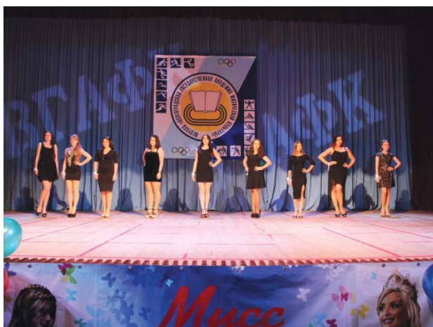
...и в коктейльных платьях

С нетерпением ждем следующего года и нового смотра красоты!