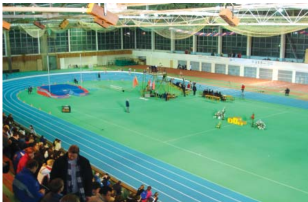
На соревнованиях по легкой атлетике в манеже

Поступающим на первый курс обучения по направлениям подготовки 49.03.01 «Физическая культура» и 49.03.02 «Физическая культура для лиц с отклонениями в состоянии здоровья (адаптивная физическая культура)» рекомендуется дополнительно предоставить медицинскую справку