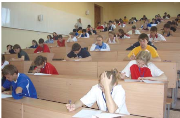
Зачетные занятия в поточной аудитории