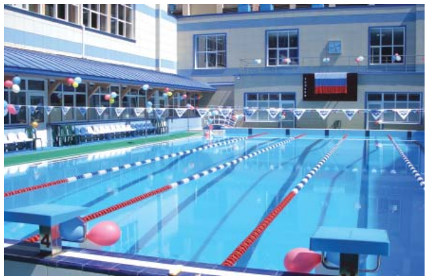
Открытый плавательный бассейн

Проезд: городским транспортом до остановки «Мамаев курган».