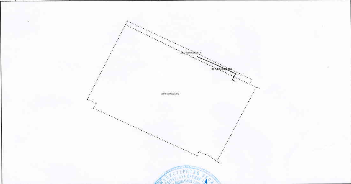
Схема расположения объекта недвижимости на земельном(ых) участке(ах):