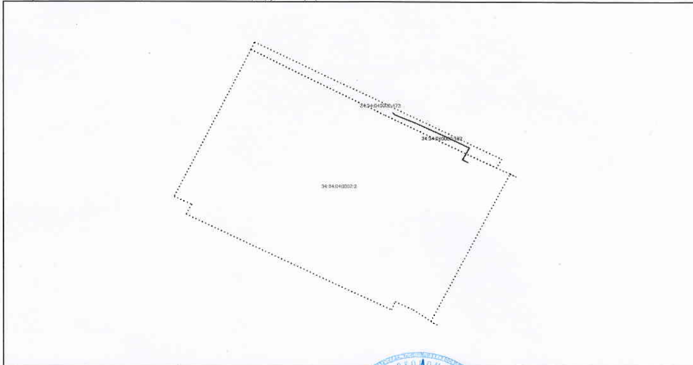
Схема расположения объекта недвижимости на земельном(ых) участке(ах):